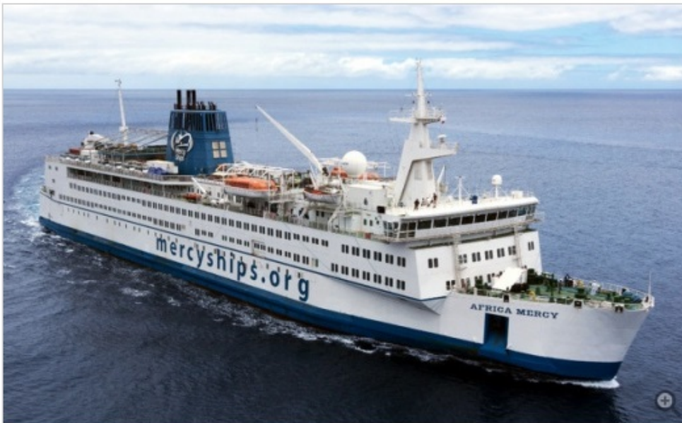
Die «Africa Mercy» ist heute das grösste private Krankenhausschiff das die Weltmeere durchkreuzt

Die Ärzte sind Spezialisten auf ihrem Gebiet. Operiert wird im Stundentakt, und zum Mittag treffen sich die Pfleger gern in der Kantine. Doch «Africa Mercy» (»Barmherzigkeit») ist kein gewöhnliches Krankenhaus, sondern das grösste nichtstaatliche Krankenhausschiff der Welt.