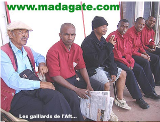
Les gaillards de l'Aft...