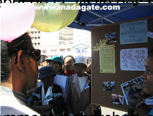
Comment chercher les enfants ?