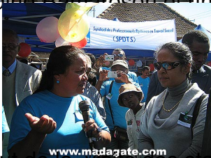
Début des stands avec Mme Jeannoda