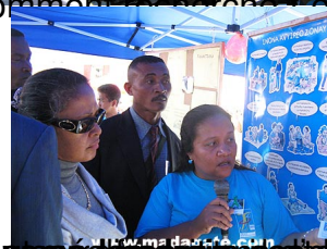
Ma disposition de l'exposition des réseaux sociaux pour échanger