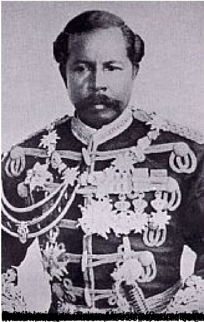
Portrait of a man in a military uniform, heavily decorated with medals and orders. The image is partially obscured by a black bar at the bottom.