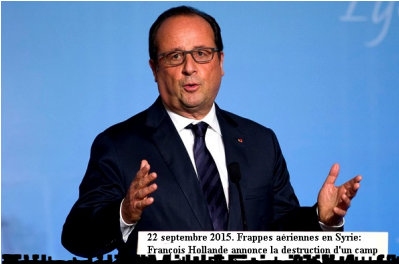
22 septembre 2015. Frappes aériennes en Syrie: Francis Hollande annonce la destruction d'un camp

Lundi, 16 Novembre 2015 04:47 - Mis à jour Mercredi, 18 Novembre 2015 05:56