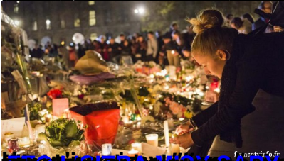
La nuit à Paris