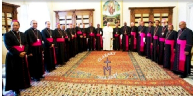
Les évêques catholiques de Madagascar entourant le Pape François

Les évêques de Madagascar lancent un cri d'alarme face aux violences et à la pauvreté qui touchent le pays. Réunis en Assemblée à Antanimena fin avril 2016, ils dénoncent « les mensonges et les vols » qui touchent « jusqu'au sommet de l'État ».