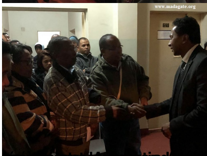
à la famille du staff, ce même 16 juillet 2018 à BituRA,