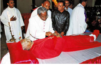
Le cardinal Razafindratandra à l'École Supérieure Catholique d'Antananarivo (ESCA),