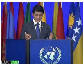
SEM Le Président de la Transition