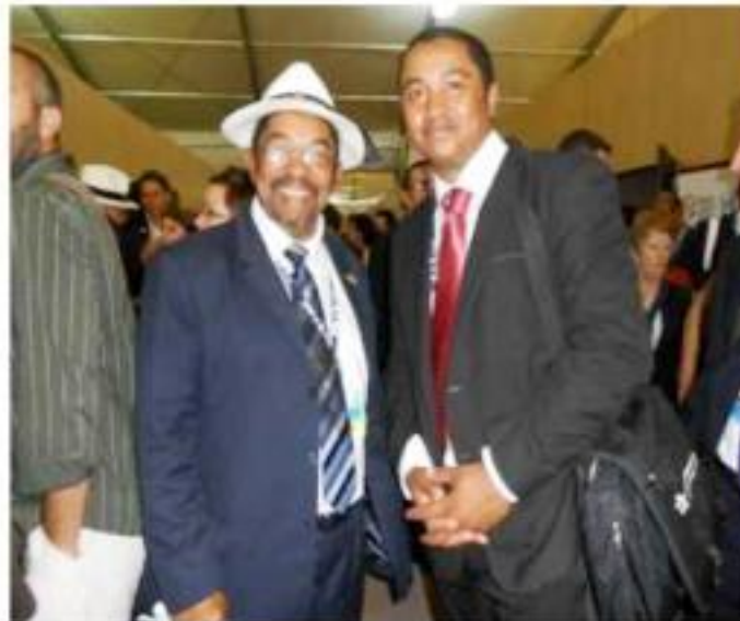
Le Ministre du Tourisme et son conseiller Technique / Le Ministre du Tourisme un des panélistes

Éléments de la participation de Madagascar à la Conférence mondiale sur le Développement durable