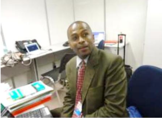
Mr le Directeur de la Gestion des Pollutions et Point Focal