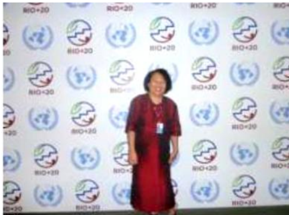
Le Chef de Service de la Communication Environnementale