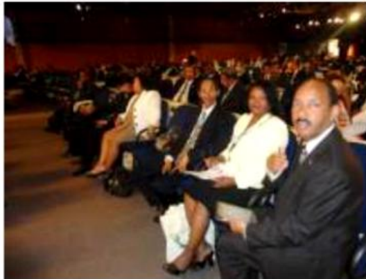
Monsieur Le Point Focal National (PFN) du Développement Durable, Mr le SG du MAE et certains conseillers

Éléments de la participation de Madagascar à la Conférence mondiale sur le Développement durable