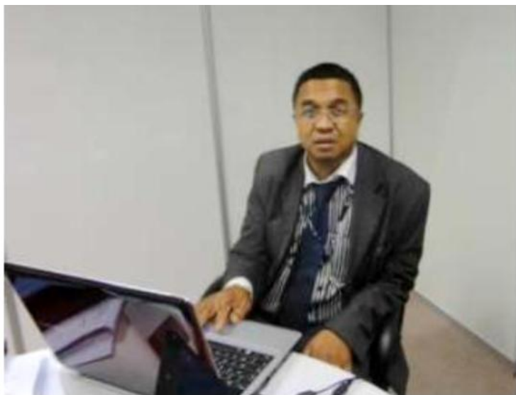
Monsieur le Directeur Général de l'Office National de l'Environnement (DG-ONE) : Membre de la délégation participant auside Event : ENERGIE

La Délégation de Madagascar pour participer à la Conférence des Nations Unies sur le Développement Durable Rio+ 20 était composée d'une délégation venant de Madagascar et d'une délégation venant de la Représentation Permanente de Madagascar auprès des Nations unies à New York. Une partie de cette délégation était arrivée à Rio de Janeiro le 12 juin 2012 et la deuxième partie le 19 juin 2012.