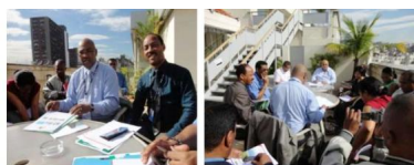
Mr le SECRETAIRE GENERAL du MEI, en tant que chef de file de l'équipe du MEI a dirigé la Réunion technique de briefing de la Délégation malgache le 19 juin 2012 à Rio de Janeiro.

participants étaient inscrits y compris le secteur privé et la société civile. Près de 130 Chefs d'Etat et de Gouvernement (dont 79 Chefs d'Etat) ont fait le déplacement à Rio. La Conférence s'est également distinguée par le nombre des activités et réunions. En effet, outre les réunions officielles, environ 500 événements en marge se sont tenus dans le Centre de Conférence et 3000 dans la ville de Rio dont le Sommet du peuple.