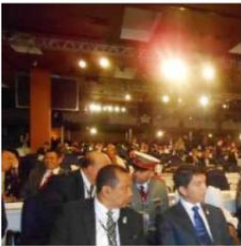
Le Ministre de l'Eau avec Mr le Président de la Transition

Les Objectifs Globaux de Développement durable des pays émergents à mettre en oeuvre la déclaration