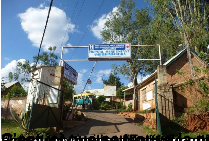
On ne peut pas aller à l'école si on n'a pas de quoi manger. C'est un problème qui se pose à Madagascar.