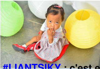
#LIANTSIKY : c'est elle