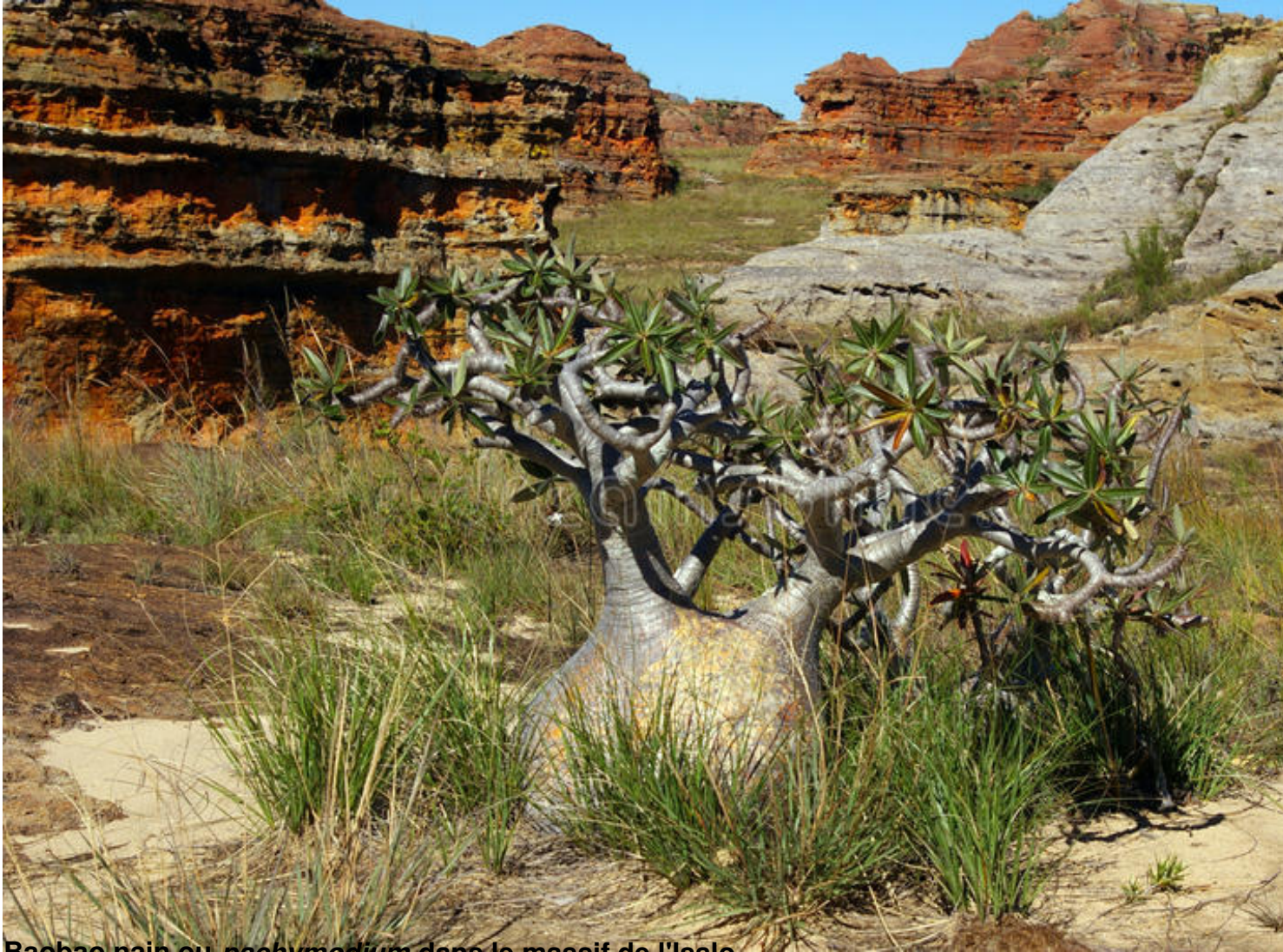
Baobab rain ou rachymonium dans le massif de l'Isalo