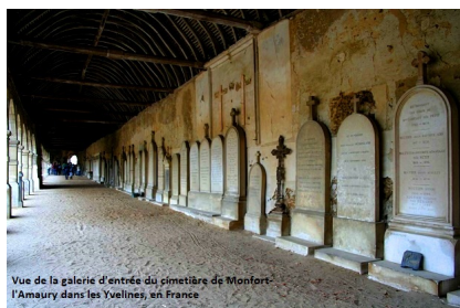
Vue de la galerie d'entrée du cimetière de Montfort-l'Amaury dans les Yvelines, en France

Charles Aznavour, auteur-compositeur-interprète, acteur et écrivain franco-arménien, a été inhumé, en toute intimité, dans l'après-midi de ce même samedi 6 octobre 2018 à Montfort-l'Amaury, dans les Yvelines, à l'Ouest de Paris.