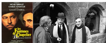
A gauche, l'affiche du film "Les Fantômes du Chapelier" sorti sur les grands écrans en 1982 A droite: Claude Chabrol (réalisateur), Michel Serrault (le chapelier) et Charles Aznavour (le tailleur)