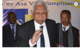
Manly Razvonjaka tena parite de ces nouveaux riches à milliards, tandis que les habitants de Sociata attendent toujours les retombées de la manne chinoise.