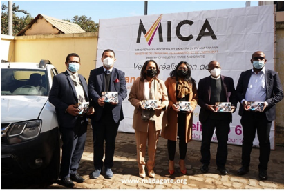
Madagascar. Collaboration MICA et ONUDI, le 15 juillet 2021