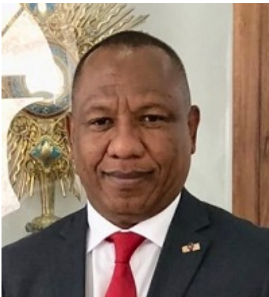
Christian Ntsay , Premier ministre, Chef de la délégation