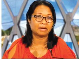
Lorsque le Doyen donne les chiffres, jamais elle ne dit combien de personnes ont subi le test sur tout. Or, dans un pays à millions d'habitants, le nombre de personnes testées est important, le nombre de personnes testées par jour est important et les chiffres sur lesquels les personnes savent ou sont testées doivent être connus.

Editorial Nombreux sont les cas oubliés !