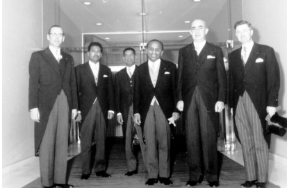
Présentation des lettres de créances de Rakoto Ratsimamanga (au centre) comme Chef de mission de Madagascar