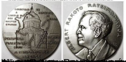
Two circular medallions, one featuring a building and the other a profile portrait of Albert Rakoto Ratsimamanga.