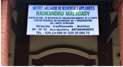
IMRA de l'avenue de l'Industrie du Futur. Union d'officiers élus sous un centre national de recherche reconnu par l'OMS.