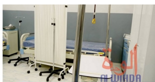
Une chambre de l'hôpital de Fatcha à N'Djamena.

. Tandremo ny vava sy ny soratra fa ny hamerina azy ireo no hanahirana ho an'izay niteny sy nanoratra azy aorina ao... Ity lahatsoratra ity tsy natao « haborosy » an'iza n'iza fa kosa mamela ny hafa iresaka mikasika ity CVO ity, izay toa mampirediredy ny sasany tsy aninona tsy aninona fa lany andro manaratsy mpiray tanindrazana isaky ny mihiratra ny masoandro (izay tsy ho hita intsony nefa rehefa injay maty, ary tsy maintsy ho faty). Ny marina dia dikan-tenin'ilay lahatsoratra nosoratan'ilay mpanao gazety Malick Mahamat amin'ny teny frantsay, ao amin'ny gazety « Al Wihda » ao Tchad, ity manaraka ity.