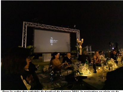
Dans le cadre des activités du Festival de Cannes 2021, la projection en plein air de "The Raphia Journey" signé Geoffrey Gaspard et produit par Eileen Akbaraly, qui

Samedi, 17 Juillet 2021 04:49 - Mis à jour Samedi, 17 Juillet 2021 08:06