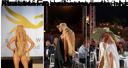
"Fashion Show" le 13 juillet 2021 au Festival cinématographique international de Cannes. Créations en raphia de M4aW Madagascar d'Eileen Akbaraly, réalisées par des artisans malgaches et portées par des mannequins de classe internationale