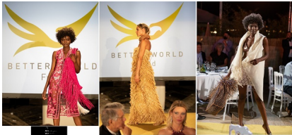
"Fashion Show" le 13 juillet 2021 au Festival cinématographique international de Cannes. Créations en raphia de M4aW Madagascar d'Eileen Akbaraly, réalisées par des artisans malgaches et portées par des mannequins de classe internationale