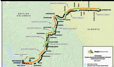
Trans Mountain Pipeline L.P. a choisi le groupement constitué de Spiecapag Canada Corp (filiale de Vinci) et Macro Enterprise Inc. pour la construction d'un oléoduc dans le cadre du projet Trans Mountain Expansion Project (TMEP) en Canada

HOA PENY MENAKA ... IZANY NY CANADA RAHA ANY I ROLAND IAROVANA?