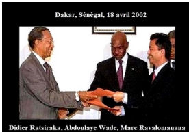
Didier Ratsiraka, Abdoulaye Wade, Marc Ravalomanana