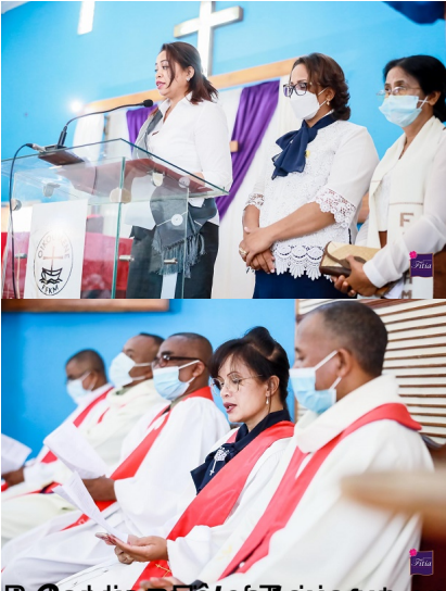
Beaumont, Ampahibe, Chapelle militaire. Service interreligieux destiné aux Femmes et à la Nation malagasy. Grand O (Gégé) de la Famille, le Pasteur