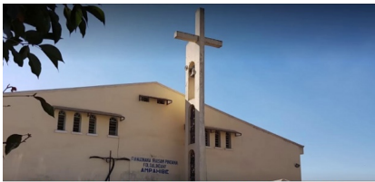
La Chapelle Générale Militaire sis à Ampahibe, Antananarivo