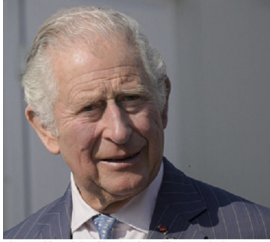
Izy no Mpanjaka Charles faha-III nanomboka ny andron'ny 8 Septambra 2022