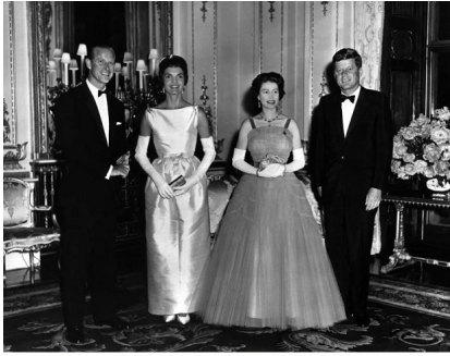
Buckingham Palace, Jona 1961. Ankavia miankavanana eo amin'ny sary : ny Prinsy Philip Mombakten: First Lady Jacqueline Kennedy; Ny Mpanjakavavy Elizabeth II; John F. Kennedy, Filohan'ny Etazonia.