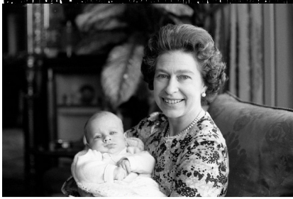
Ny Mpanjakavavy Elizabeth II sy Peter Phillips, zatikeliny voalohany. Sary nalain'ny Lord Snowden (Antony Armstrong-Jones) tamin'ny taona 1947. Rehefa niamboho izy, ny 8 Septambra 1992.