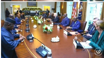
Cabinet room de la Maison Blanche, à Washington DC, le mercredi 14 décembre 2022. Pour une rencontre multilatérale, le Président Joe Biden a réuni six présidents africains qui tiendront, dans leur pays respectif, des élections en 2023. Il s'agit du Gabonais Ali Bongo, du Nigérian Muhammadu Buhari, du Libérien George Weah, du Sierra Léonais Julius Maada Bio, du Malgasy Andry Rajoelina et du Congolais Félix Tshisekedi.