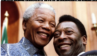
Le Président Nelson Mandela et Edson Arantes do Nascimento, alias le footballeur Pelé, en 1985.