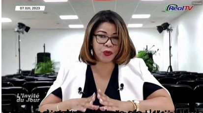
Figy An'ny Haintan'ny Filôzôfa an'ny Tany an'ny Miasa an'ny tanàna an'ny Ranja an'ny Gaskana (07 Jul 2023) by Gascar Fenosoa (20 Jul 2023)