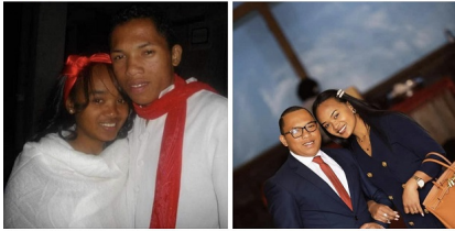
15 juin 2022 · 🌐

Avant et Après 2012 - 2022 🤔👉 10 taona aty aorina 👉👉👉👉👉