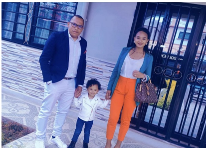
Figy An'ny Haintan'ny Filôzôfa an'ny Tany an'ny Miasa an'ny tanàna an'ny Ranja an'ny Gaskana (07 Jul 2023) by Gascar Fenosoa (20 Jul 2023)