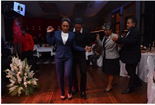
Publié par lachasseinfo le 25 juillet 2017