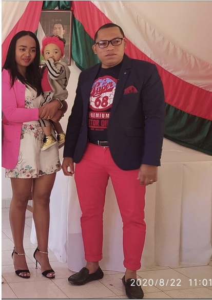
Gascar Mandrindrivony 29 oct. 2022 · 🌐

Mercredi, 19 Juillet 2023 15:23 - Mis à jour Jeudi, 20 Juillet 2023 06:19