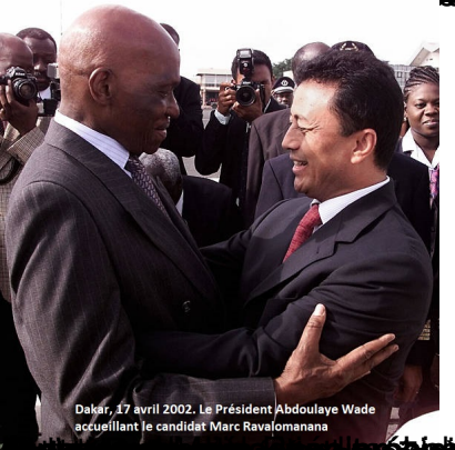
Dakar, 17 avril 2002. Le Président Abdoulaye Wade accueillant le candidat Marc Ravalomanana

Le président malgache Marc Ravalomanana a décidé de remettre le pouvoir à l'armée, à l'issue d'un bras de fer de trois mois avec l'opposition. Celle-ci a déclaré que son leader, Andry Rajoelina, allait diriger l'autorité de transition.