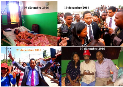
MADAGATE.ORG VOUS SOUHAITE UNE BONNE ET HEUREUSE ANNEE 2017. CELLE DE LA REDEMPTION POUR LES UNS, DE LA PUNITION POUR D'AUTRES ...