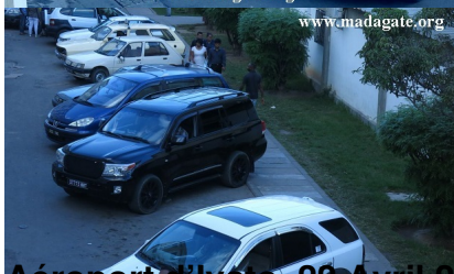
Aéroport d'Ivato, 22 Avril 2017

20h00 - Arrivée à l'aéroport d'Ivato. Le président de la République, et du