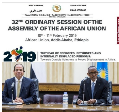
Le Président de l'Égypte, Abdel Fattah El-Sissi, et le Président du Rwanda, Paul Kagame

Les 10 et 11 février 2019, aura lieu au « Nelson Mandela Hall, AUCC, à Addis-Abeba en Éthiopie, le 32ème sommet ordinaire des chefs d'État et de gouvernement des pays membres de l'Union africaine, dont le thème sera :