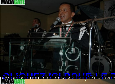
CLIQUEZ ICI POUR LE DISCOURS DU GENERAL RICHARD RAVALOMANANA