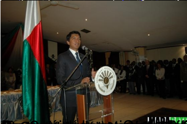
CLIQUEZ ICI POUR LA VIDEO DU DISCOURS DU GENERAL RATSIMANDRAVA RICHARD