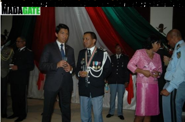
CLIQUEZ ICI POUR LA VIDEO DU DISCOURS DU GENERAL RICHARD RAVALOMANANA EN PLEINE DISCUSSION AVEC D'AUTRES OFFICERS MILITAIRES