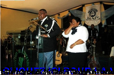
CLIQUEZ ICI POUR LA VIDEO DU DISCOURS DU GENERAL PRUNG RAZA FINDRAKOTO