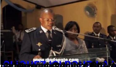
CLIQUEZ ICI POUR LA VIDEO DU DISCOURS DU GENERAL RANDRIANAZARY