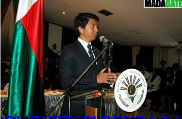
CLIQUEZ ICI POUR LA VIDEO DU DISCOURS DU PRESIDENT ANDRY RAOJELINA