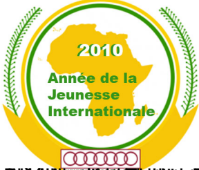
Année de la Jeunesse Internationale 2010