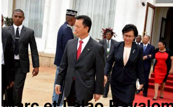
Le président de la République Hery Rajaonarimampianina et sa femme.