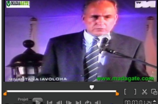
Discours de Hery Rajaonarimampianina, Président de la République, lors de la cérémonie de la prise de possession de la présidence de la République