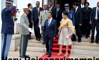
Hery Rajaonarimampianina, Président de la République, et son épouse