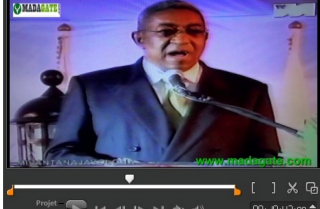
Discours de Hery Rajaonarimampianina, Président de la République, lors de la cérémonie de la prise de possession de la présidence de la République