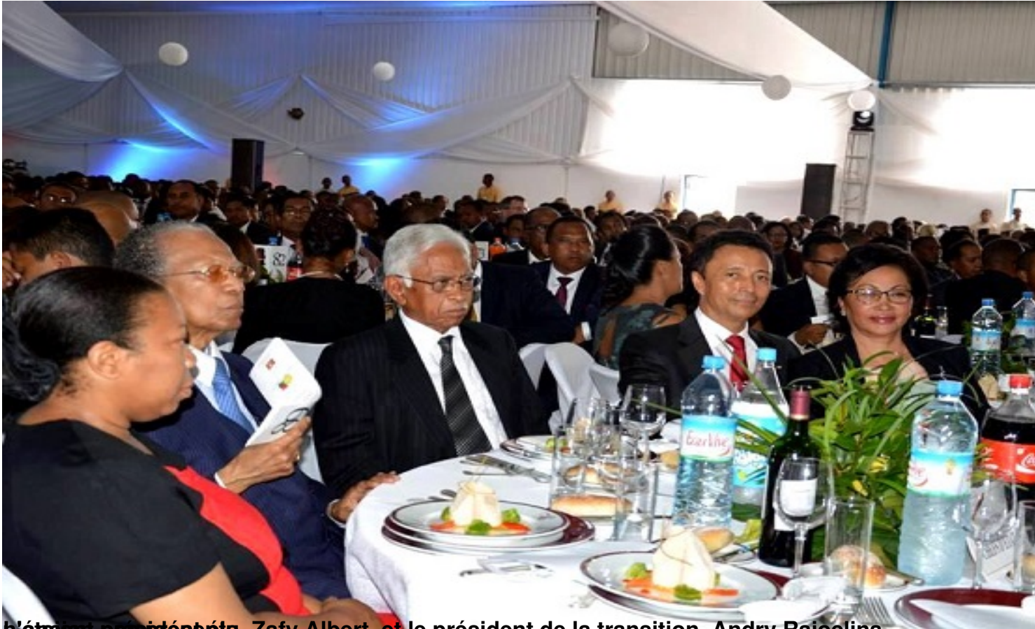
Hôte d'honneur, Zafy Albert, et le président de la transition, Andry Rajoelina,