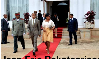
Jean-Eric Rakotoarisoa, Président de la Haute Cour Constitutionnelle, et son épouse