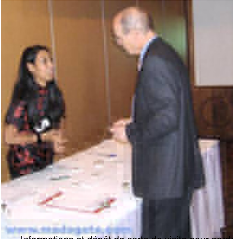
Informations et dépôt de carte de visite pour garder le contact