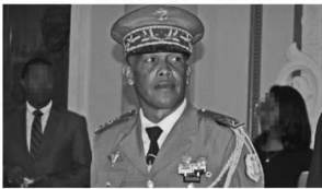
«Razan' ny Repoblika ny hamerina ny fahavononana. Ao anatin' ny vava ony asan' ny fiaraman - pahahefana ao anatin' ny velirano IEM. Nampiasa fahavononana hanatanteraka izany ny ministry ny Fiarovan - prenena vavaho.»