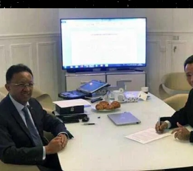
Paris (France), 10 Desambra 2019. Nikaosy ny filoha teo aloha, Hery Rajoanarimampianina sy Marc Ravalomanana. Tadio fa ny voalohany dia banagadra ny fakarao tany Antsiranan' ny taona 2014. Izany no faovana politika eto Madagasikara. Tombontsoa ilany, tombontsoa...