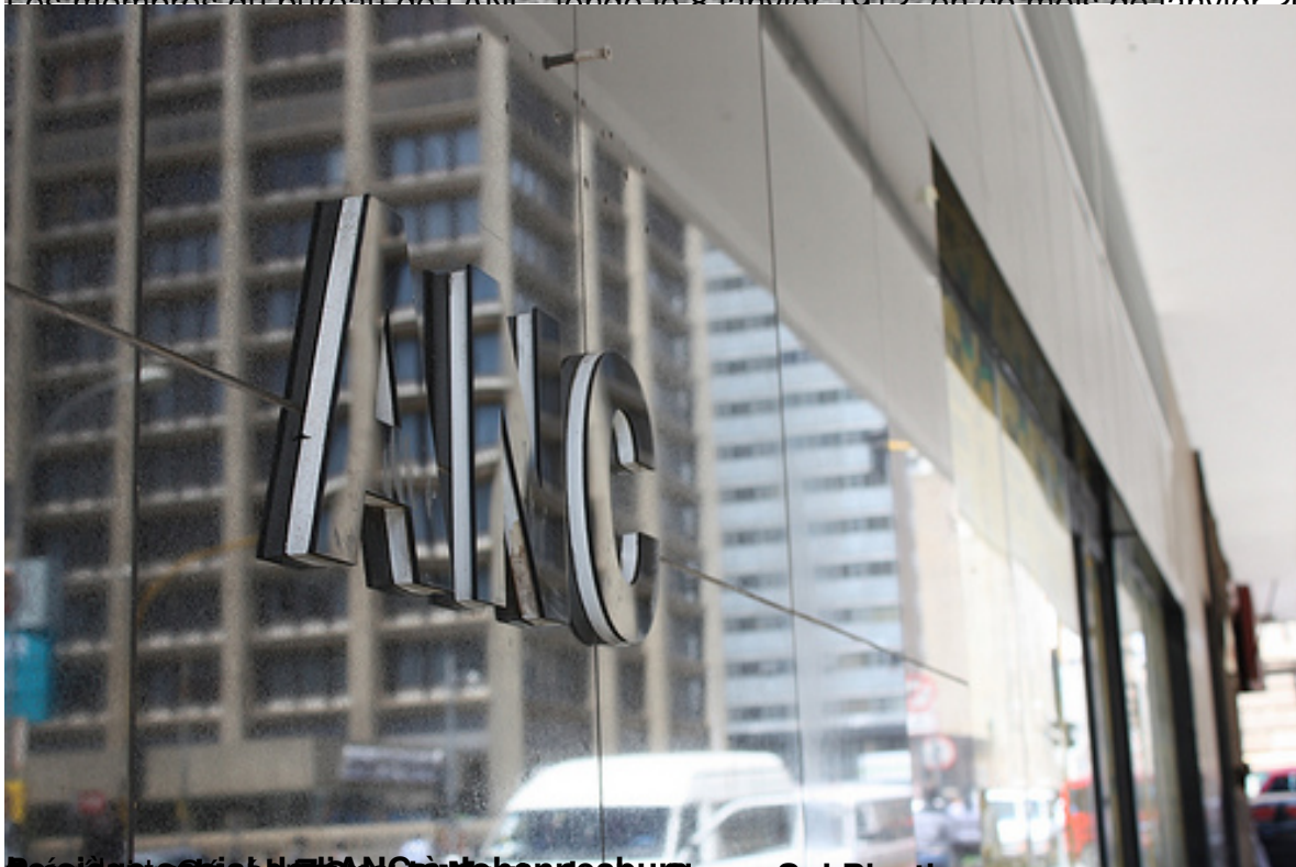
Président Chris Hani ANC Gauteng, Skhema, Sol Plaatje, province du Gauteng