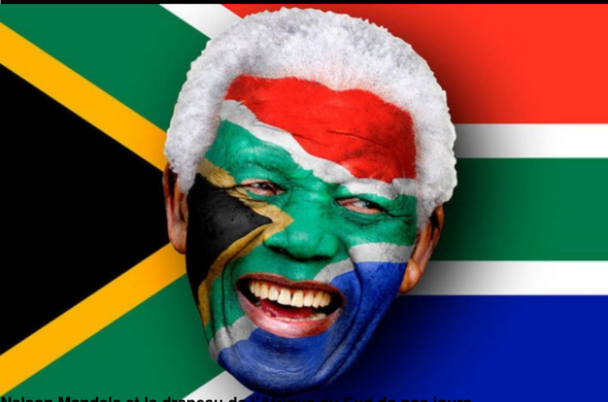
Nelson Mandela et le drapeau de l'Afrique du Sud de nos jours