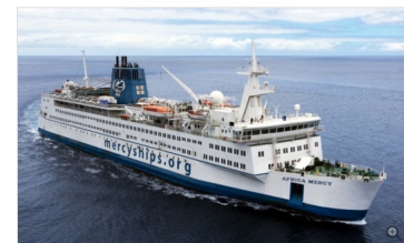
Die «Africa Mercy» ist heute das grösste private Krankenschiff das die Weltmeere

Die Ärzte sind Spezialisten auf ihrem Gebiet. Operiert wird im Stundenakt, und zum Mittag treffen sich die Pfleger gern in der Kantine. Doch «Africa Mercy» («Barmherzigkeit») ist kein gewöhnliches Krankenhaus, sondern das grösste nichtstaatliche Krankenschiff der Welt.