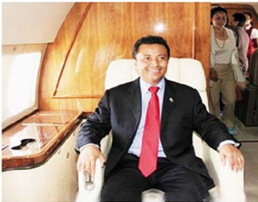
Marc Ravalomanana lors de la présentation de Force one le 8 janvier à Iloilo.

L'ancien président de la République a écopé de quatre ans de prison ferme à l'issue d'un procès concernant l'achat de l'avion présidentiel. Le verdict a été rendu mardi par contumace.