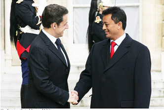
Nicolas Sarkozy recevant Marc Ravalomanana à l'Élysée, en avril 2008

reposant sur des questions « d'avances » chiffrés en millions de dollars. Chercher une preuve écrite serait comme chercher une aiguille dans une botte de foin. Mais la suite prouve qu'il n'y a jamais eu de hasard et qu'il y a un lien entre cette audience et l'achat d'un Boeing de troisième main.