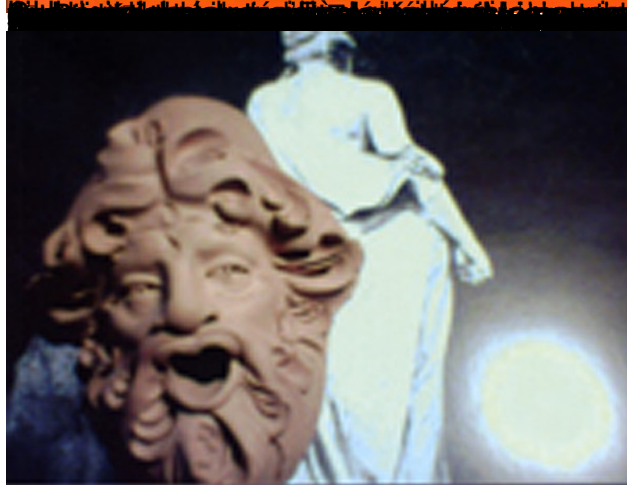
Diogène le Cynique