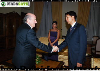
Sepp Blatter, président de la FIFA, et le président de Madagascar, Andry Rajoelina, lors de leur rencontre à Antananarivo.