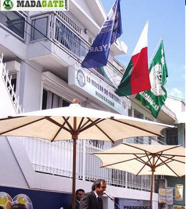
Sepp Blatter et Ahmad Mialy lors de leur rencontre à Antananarivo.