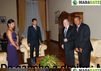
Sepp Blatter et Andry Rajoelina. Au centre, la Première Dame