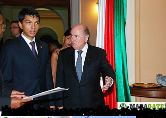
En route vers la table du dîner