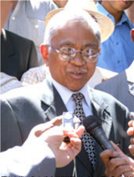
Andriamandisoana Ravalomanana, Président de la République de Madagascar, lors d'une conférence de presse à Paris le 15 septembre 2011.