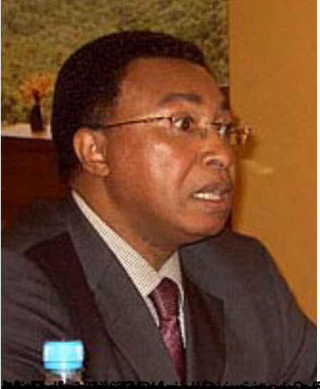
Andriamandisoana Ravalomanana, Président de la République de Madagascar, lors d'une conférence de presse à Paris le 15 septembre 2011.