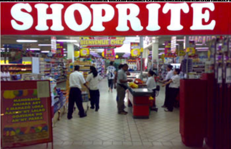
Un magasin Shoprite à Antananarivo, Madagascar, le 15 septembre 2011.