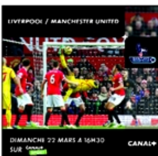
Le match de football Liverpool / Manchester United, diffusé sur Canal+.