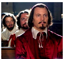
Tchéky Karyo en Cardinal de Richelieu