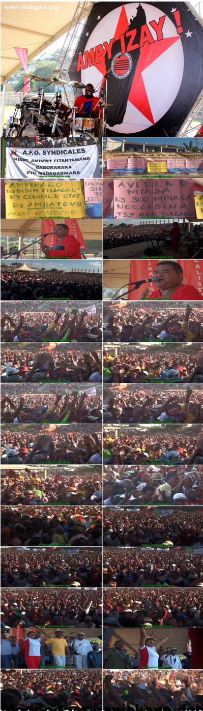
Samboany an'angaran'ny 45 ny 2016 "lom-bitsy" ireo izany? Sambory daholo dia gadrao!