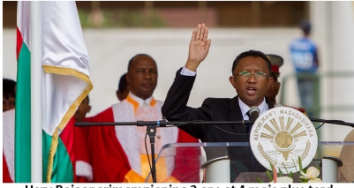
Hery Rajaonarimampianina 2 ans et 4 mois plus tard