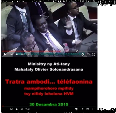
Sendika eto Madagasikara : mpanainga sy mpangalatra ny mpitondra