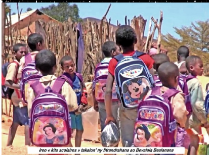
Ireo « kits scolaires » takalon' ny firandrahana ao Bevalala Bealanana