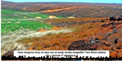
Ireny dongona ireny no tany avy so anaty lavaka nangadiant' ireo Sinoa nakana