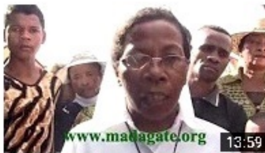
ILAKAKA Fanjakana ao anaty fanjakana 27 04 2017

Ilakaka. Quand un Dg des Mines ridiculise le pouvoir du Premier ministre combattant, Mahafaly Olivier Solonandrasana