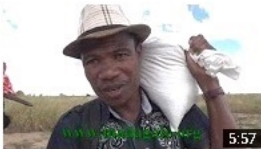
ILAKAKA Orinasa Gondwana mambotry vahoaka 27 04 2017