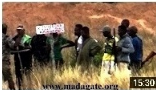
ILAKAKA Dg Mines ambony noho ny PM 27 04 2017 1 075 vues ·