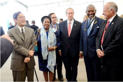
From left to right: Robert Yamate (US Ambassador); Sheila Jackson Lee (US Representative, Democrat, Texas); Blake Farenhold, US Representative, Democrat, Texas); Robert Goodlatte (US Representative, Virginia); Greg Meeks, US representative, Democrat, New York); Steven King (US Representative, Democrat, Iowa)

Mbola tsy nisy mpitondra mpandainga sy tsy miraharaha vahoaka toa ireto Hvm ireto mihitsy teto Madagasikara, hatramin'izay niainako. Ary efa ela nihetezana aho fa tsy zaza vao omaly akory. Manana ny tombontsoany eto tokoa aloha ny Etazonia, toa ireo firenena matanjaka rehetra aty Afrika. Kanefa, tsy misangy mihitsy ry zareo rehefa resaka fitondra tsara tantana (« Bonne gouvernance »