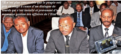
Mercredi 11 avril 2018, Hôtel « Chez Grégoire », Besarety Antananarivo. Des Généraux et officiers supérieurs des forces armées malgaches ont lancé un appel adressé aux dirigeants, aux politiciens et aux frères d'armes

Face au mépris affiché par les actuels tenants du pouvoir à Madagascar, vis-à-vis des signaux d'alerte lancés par toutes sortes d'entités sociales, économiques et politiques d'ici et d'ailleurs, et suite aux les évènements qui se sont produits au sein de l'Assemblée Nationale, annonçant une nouvelle crise incontournable, des Généraux et Officiers supérieurs de la Nation ont lancé un appel à l'adresse des dirigeants, des politiciens et de leurs cadets des forces armées en exercice.