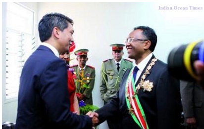
Mahamasina, 25 janvier 2014. Andry Rajoelina félicite son excellent Ministre des Finances et du Budget devenu Président de la république. Tous les espoirs étaient permis pour les Malgaches. Hélas, en 2018, Madagascar est devenu le 46 pays le plus pauvre de la Terre

Encore une preuve, non pas de l'incompétence de cet expert-comptable formé au Canada, mais de sa volonté d'avoir littéralement coulé son propre pays devenu, en moins de 5 ans, le 4ème pays le plus pauvre de la planète Terre . Or, de 2009 à 2014, il était le ministre des Finances et du Budget du régime de transition dirigé par Andry Rajoelina. Durant cette période, il a été un excellent exécutant ayant même reçu des félicitations de la part de la Banque mondiale. Mais la vérité vraie est qu'il suivait des directives strictes de la part du président de la transition. Il était vraiment à bonne école.