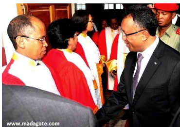
Jean-Eric Rakotoarisoa félicité par Hery Rajaonarimampianina, le Président de la République qui l'a fait devenir Président de la Haute cour constitutionnelle de Madagascar durant 7 années pleines. Chapeau les gars !

Depuis l'accessibilité pour tous des réseaux sociaux, des tas de créatures anonymes -qui ne feront jamais que passer sans rien laisser derrière eux- adorent inventer des histoires, surtout sur la vie des autres. Mais l'Histoire, avec un grand H, elle, ne s'invente pas car reposant sur des faits réels avec des preuves concrètes à l'appui. Ainsi de la date du 26 mai 2018 à Madagascar, il y a 3 ans jour pour jour aujourd'hui 26 mai 2021. Que s'est-il passé ce jour-là et pourquoi ?