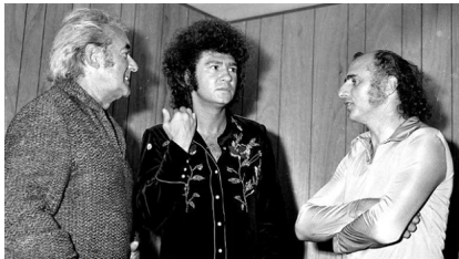
De gauche à droite : Félix Leclerc, Robert Charlebois, Gilles Vigneault

à la botte du régime Hvm. A présent, il faut se faire une raison : les coups d'état à l'africaine sont révolus.