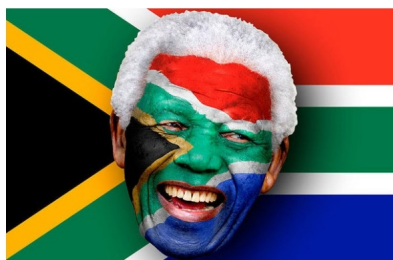
Nelson Rolihlahla « Madiba » Mandela (1918-2013)

En Afrique du Sud, sous le régime de l'apartheid, le procès de Rivonia (nom d'une commune située dans la banlieue de Johannesburg), a eu lieu du 9 octobre 1963 au 12 juin 1964 devant la haute cour du Transvaal, région située alors dans le Nord-est de l'Afrique du Sud. Etaient mis en cause une dizaine de dirigeants de l'Umkhonto we Sizwe ou MK, la branche armée de l'ANC (Congrès national africain) pour sabotage, destruction de biens (tous deux passibles de la peine capitale), violation de la loi sur l'interdiction du communisme. Parmi eux, Nelson Mandela Nelson Mandela, qui purgeait déjà une peine de prison de cinq ans pour avoir incité des travailleurs à faire grève et pour avoir quitté le pays illégalement.