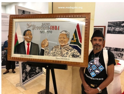
Votre serviteur lors de l'exposition organisée au CCI Ivato, le 17 avril 2019

Nelson Mandela était enfin libre après 27 ans, 6 mois et 6 jours d'emprisonnement.