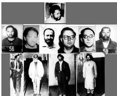
Les accusés du procès de Rivonia. En haut, Nelson Mandela. En bas, à droite, ressemblant à Charlot, Walter Sisulu. Avant lui, Govan Mbeki (en bonnet), père du futur président Thabo Mbeki. Sept de ces accusés seront condamnés à la prison à vie pour sabotage

Le 5 août 1962, Nelson Mandela est arrêté avec l'aide de la CIA américaine. Il faut dire que l'ANC faisait partie des organisations classées comme « terroristes ». Le 9 octobre 1963 commença donc le procès de Rivonia. Malgré la situation ne plaidant pas en sa faveur, ce sera pour Nelson Mandela une occasion de s'exprimer. Voilà ce qu'il a dit lors du procès : « Toute ma vie, je me suis consacré à la lutte pour le peuple africain. J'ai chéri l'idéal d'une société libre et démocratique dans laquelle toutes les personnes vivraient ensemble en harmonie. C'est un idéal pour lequel j'espère vivre et agir. Mais, si besoin est, c'est un idéal pour lequel je suis prêt à mourir ».